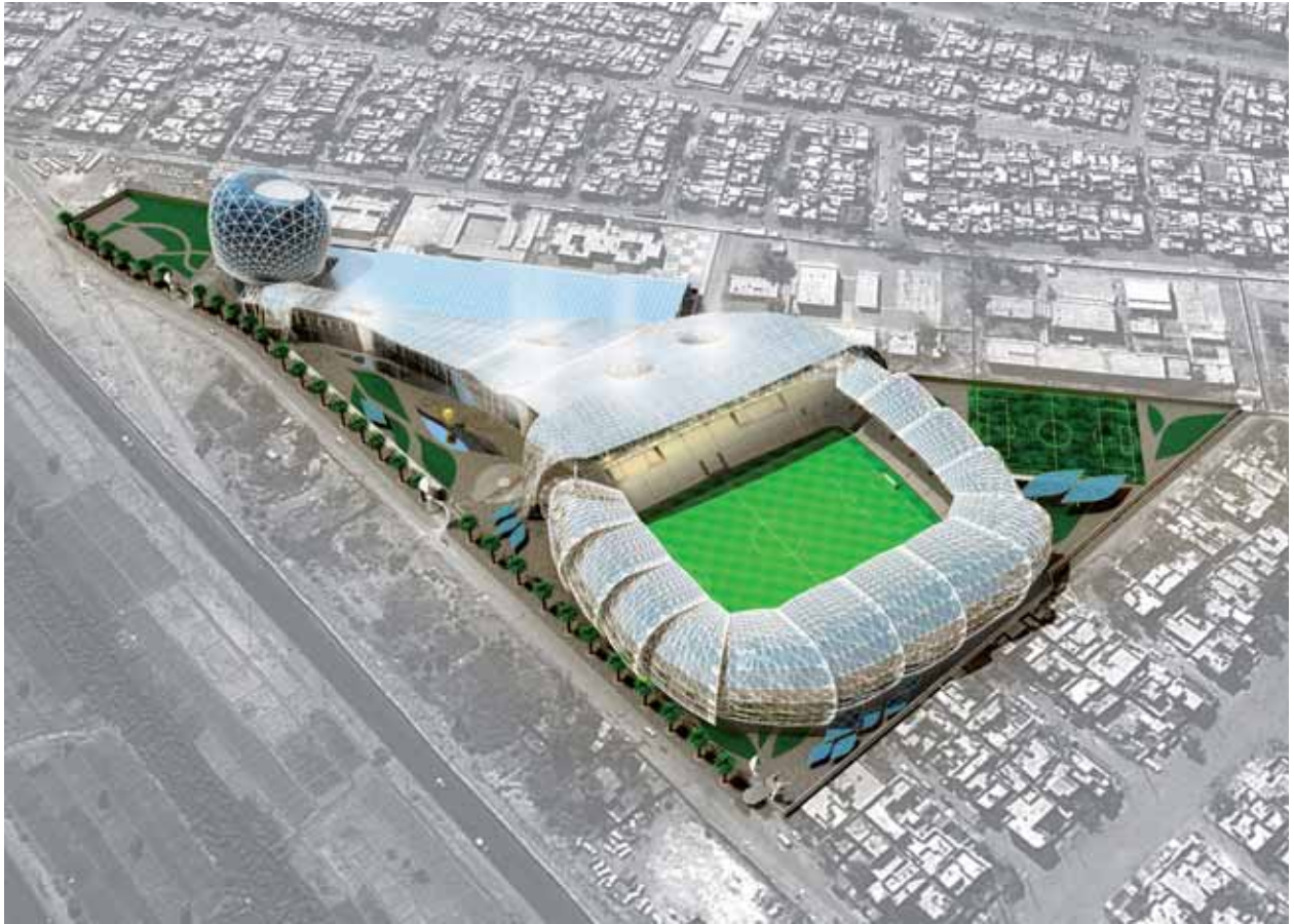
Centro polideportivo Al Talaba, en Bagdad.